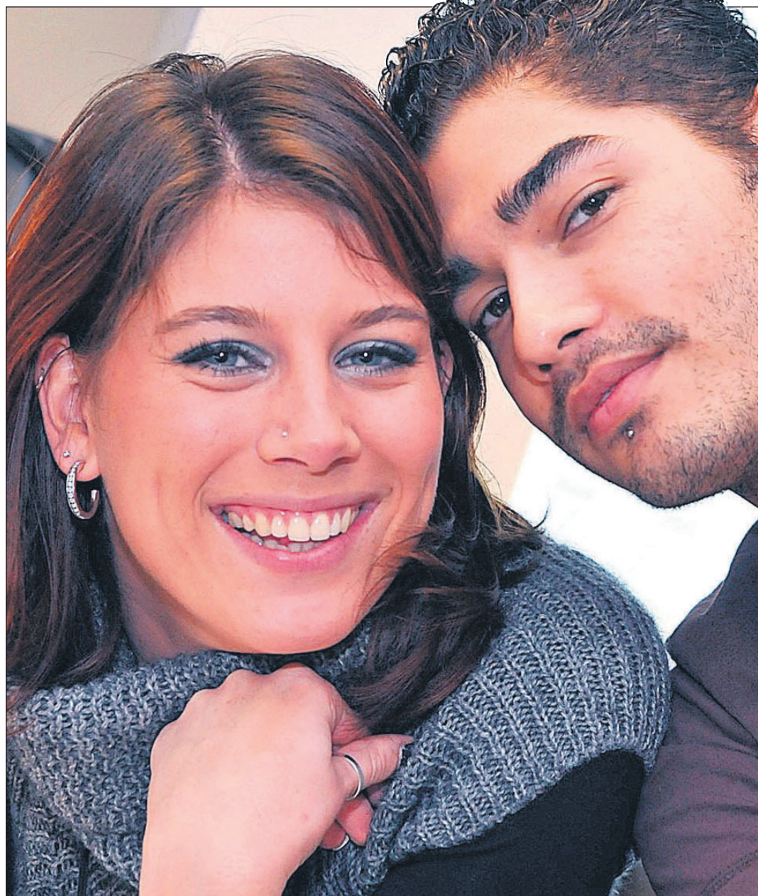
Topdarter Jelle Klaasen is tegenwoordig veel in Hengelo te vinden bij z'n vriendin Nanke. "Hengelo bevat me prima, er sluipen zelfs al Twentse woorden door mijn Brabantse accent!"